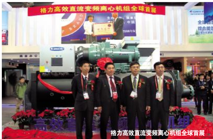
格力高效直流变频离心机组全球首展

(上接一版)在格力展位可以看到,特意前来格力展位参观、洽谈的国内外观众、客户络绎不绝。他们对格力带来的高效直流变频离心机组、GMV5全直流变频多联机组、盐水螺杆式液体冷却机组、格力GIMS智能管理系统、直流变频多联空调热水机组、R290新冷媒应用、物联网空调、空气能热水器等核心技术产品表示出了浓厚的兴