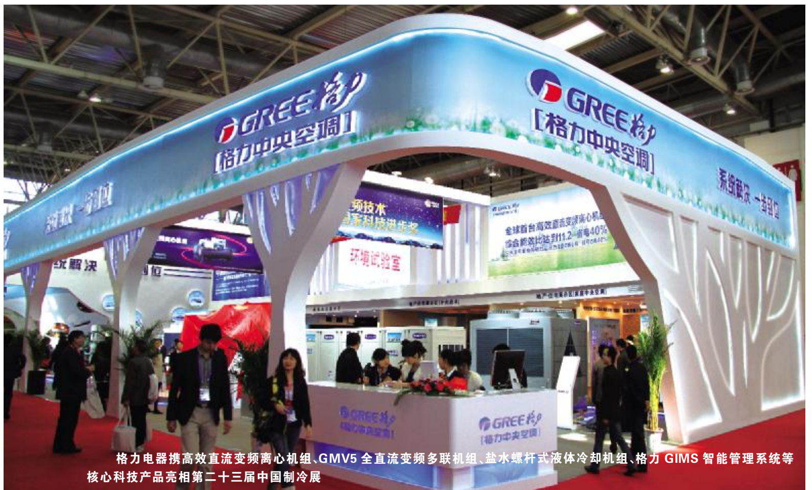
格力电器携高效直流变频离心机组、GMV5全直流变频多联机组、盐水螺杆式液体冷却机组、格力GIMS智能管理系统等核心技术产品亮相第二十三届中国制冷展

此外,格力电器还将坚持以制冷设备为核心,加大关键零部件、配件的研发力度,加强和完善空调压缩机、电机等核心部件的配套生产能力;不断提升产品科技含量,进一步完善产品线和优化产品结构,实现产业升级。