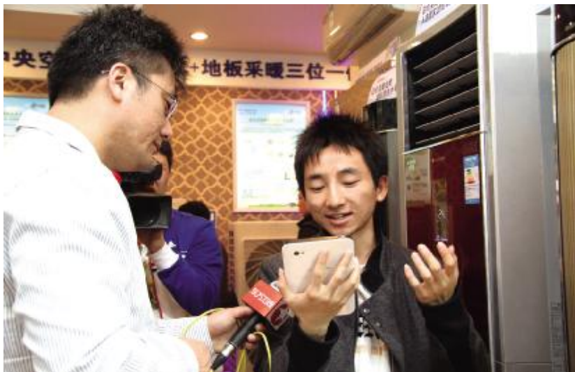
第二十三届中国国际制冷展上,格力提供物联网空调给参观者现场试用

本报讯 4月11日,在第二十三届中国制冷展上,格力电器携手中国移动发布了最新的物联网空调产品。